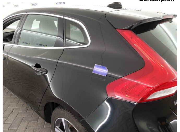
2. Zijwand - achter - Links