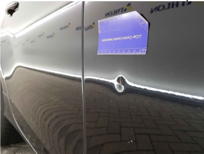
5. Portier voor - rechts