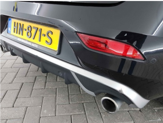
6. diffuser achter