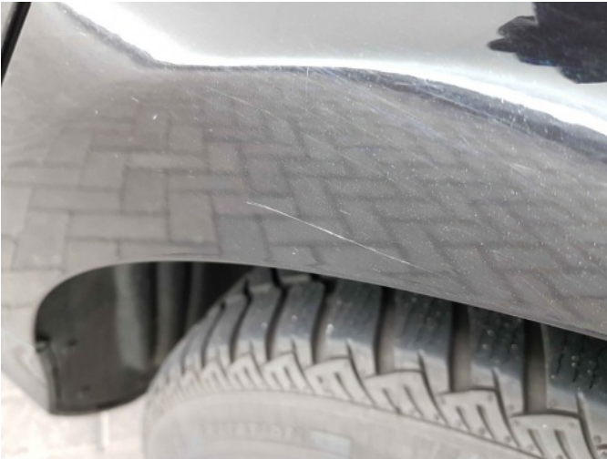
2. Zijwand - achter - Links