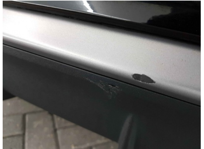
6. diffuser achter