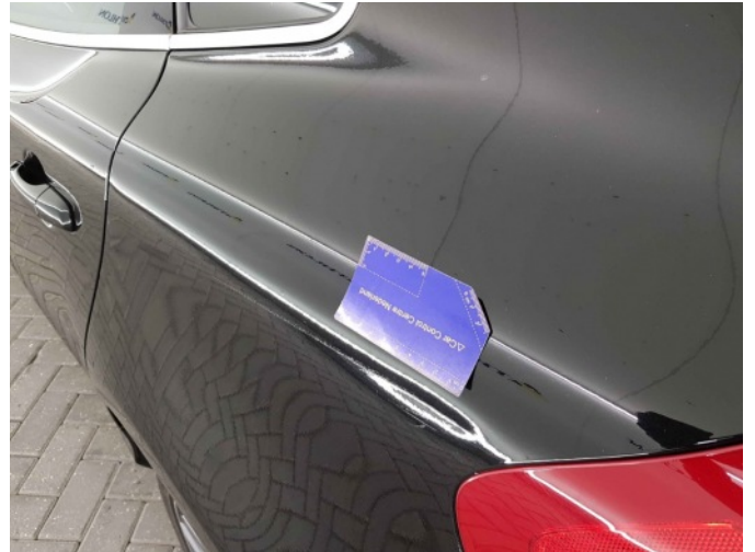
2. Zijwand - achter - Links