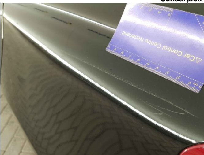
2. Zijwand - achter - Links