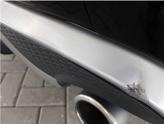
6. diffuser achter