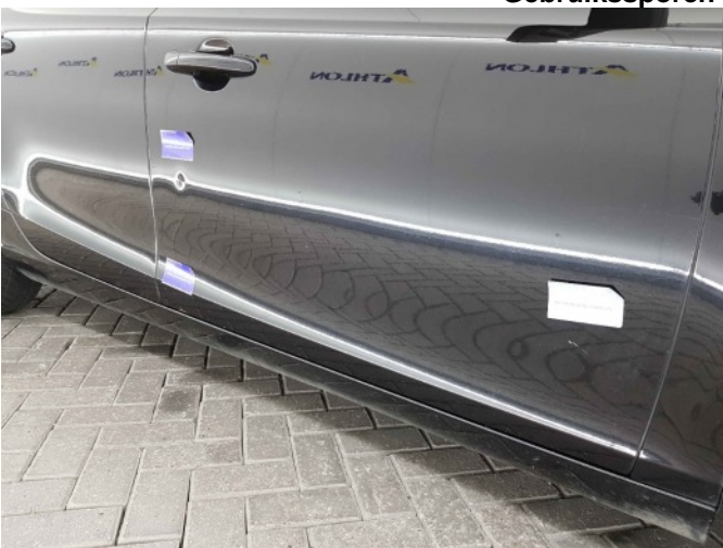
5. Portier voor - rechts