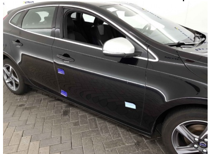
5. Portier voor - rechts