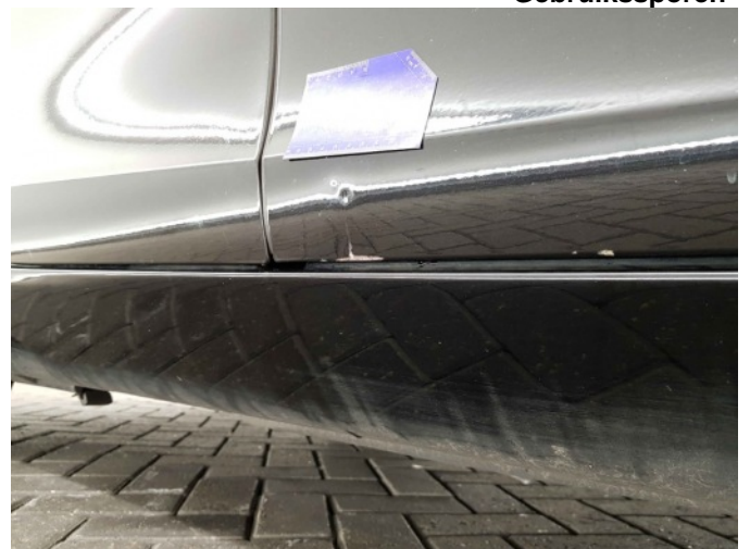
5. Portier voor - rechts