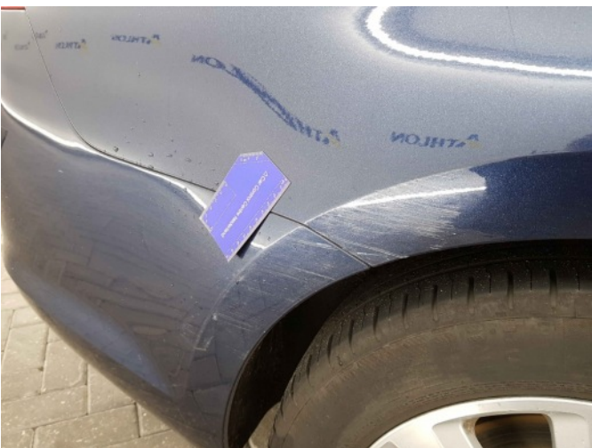
1. Zijwand - achter - rechts