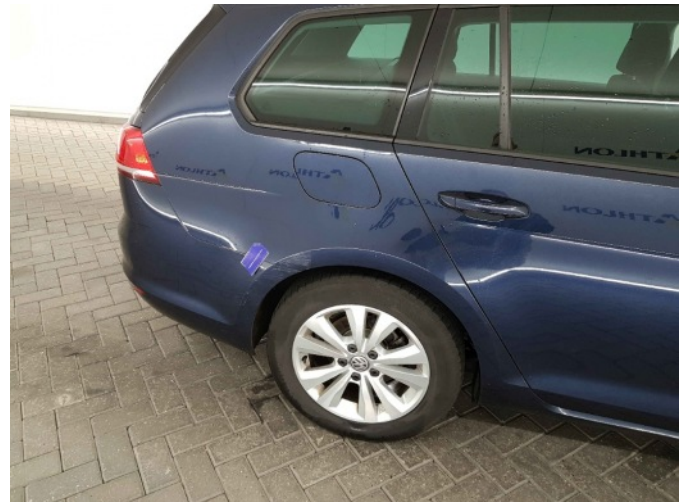
1. Zijwand - achter - rechts