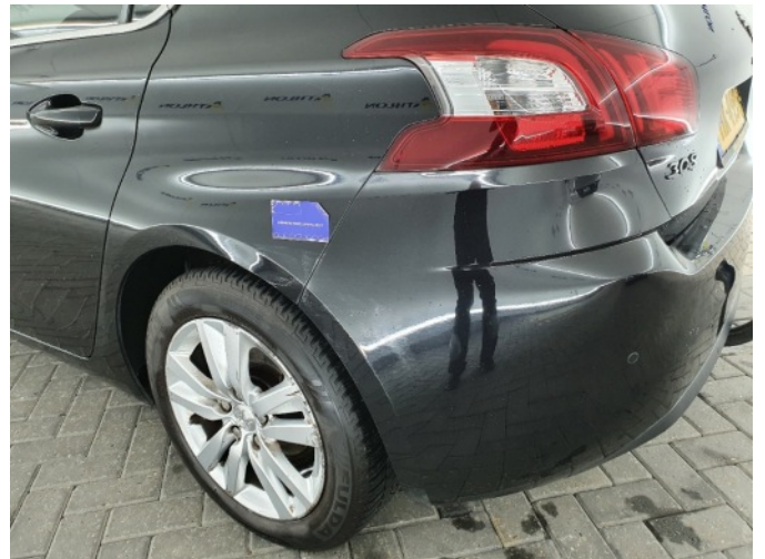
1. Zijwand - achter - Links