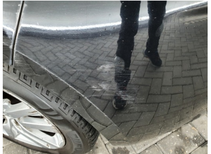
1. Zijwand - achter - Links