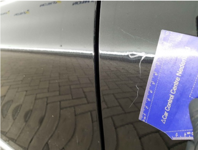
1. Portier achter - links