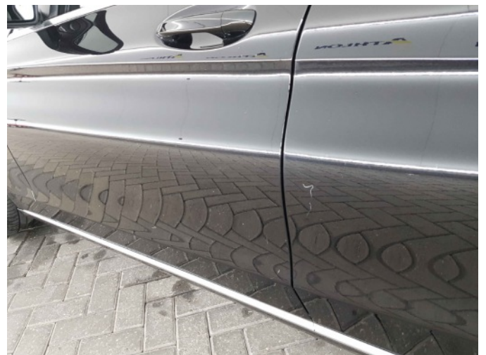
1. Portier achter - links