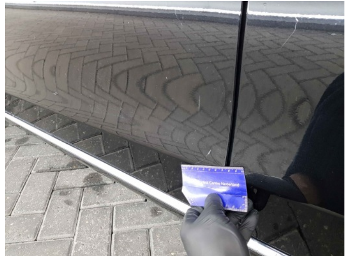
1. Portier achter - links