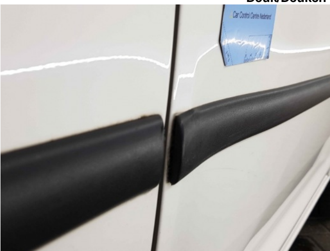
2. Portier voor - rechts