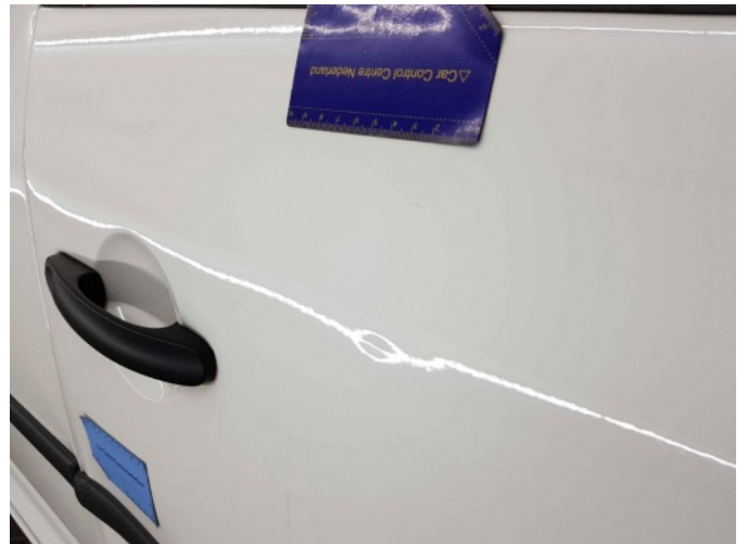
2. Portier voor - rechts