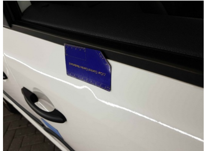
2. Portier voor - rechts