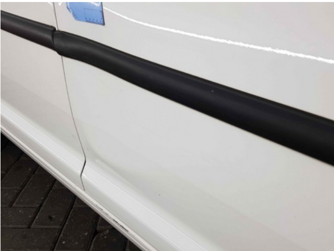
2. Portier voor - rechts