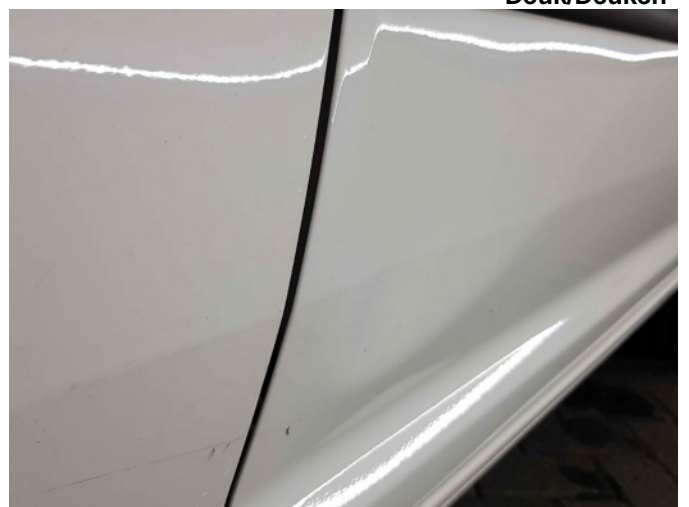
2. Portier voor - rechts