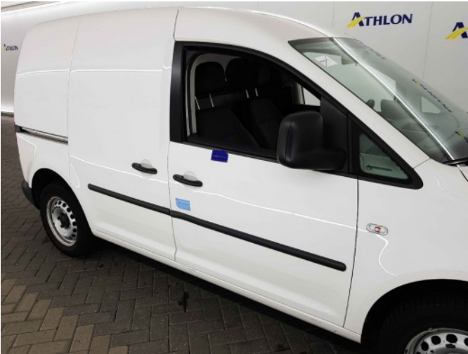
2. Portier voor - rechts