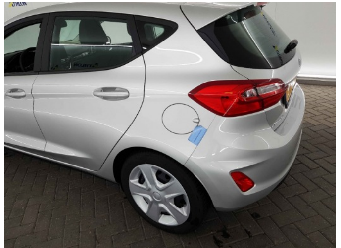
1. Zijwand - achter - Links