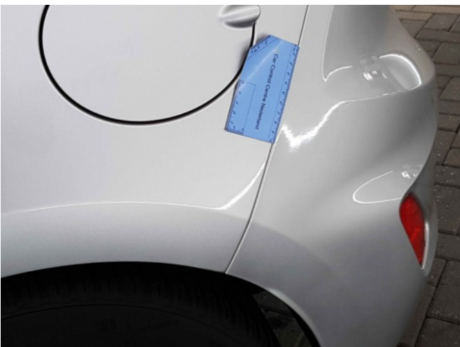
1. Zijwand - achter - Links