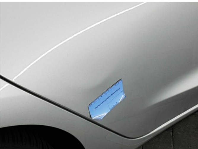
1. Portier achter - rechts