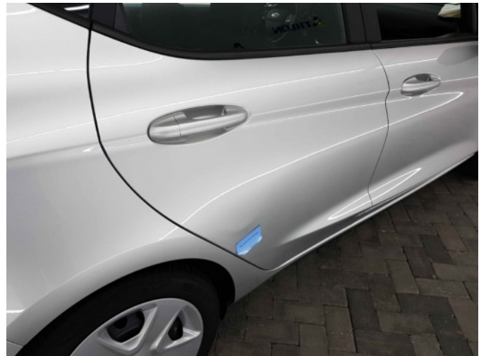
1. Portier achter - rechts