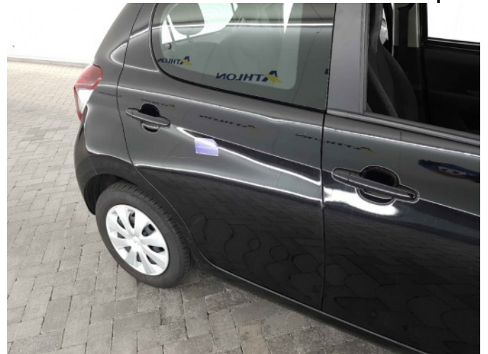
3. Portier achter - rechts