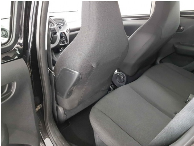
4. rugleuning l.v. stoel