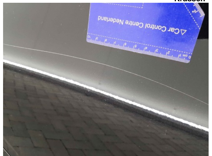
3. Portier achter - rechts