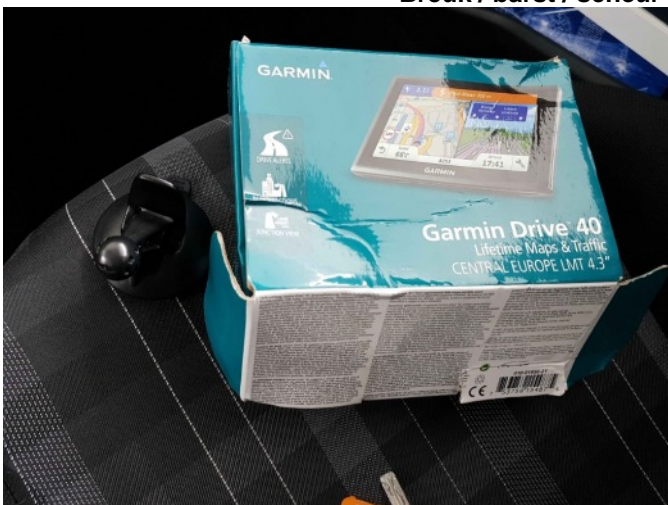
5. Garmin navigatie ontbreekt