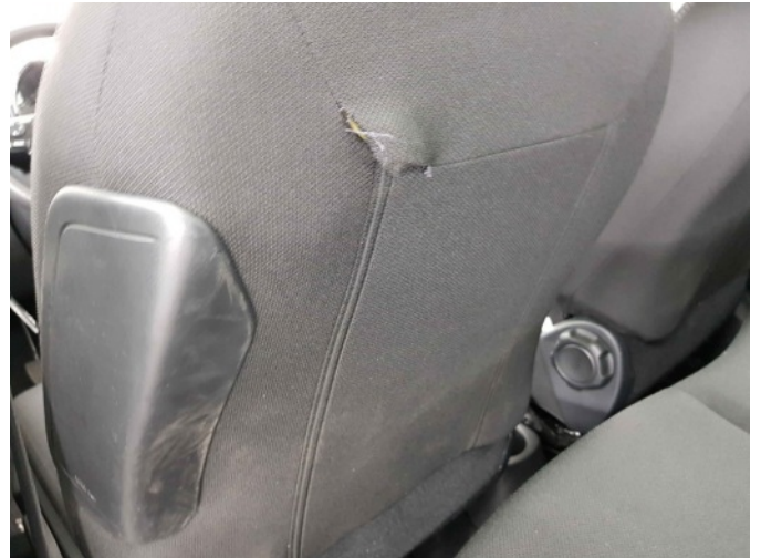
4. rugleuning l.v. stoel