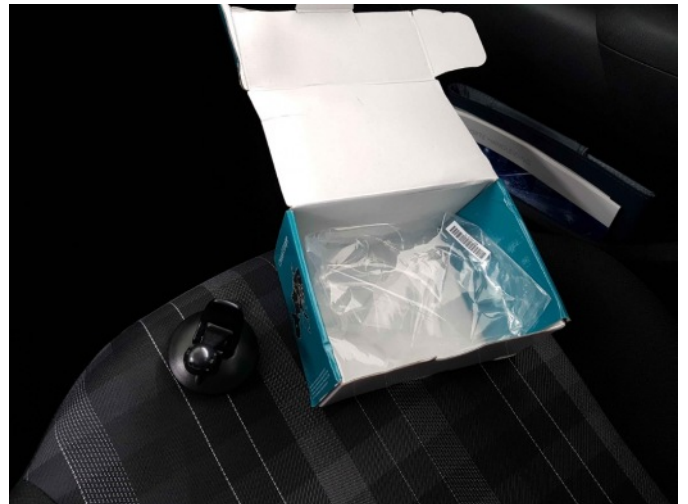
5. Garmin navigatie ontbreekt