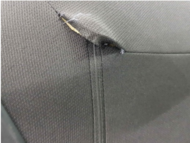
4. rugleuning l.v. stoel