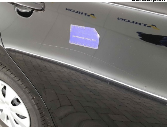
3. Portier achter - rechts