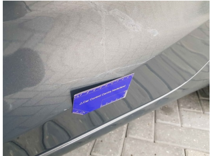
2. Portier achter - links