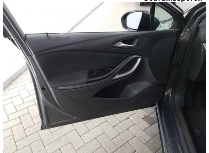
4. Deurbekleding links voor