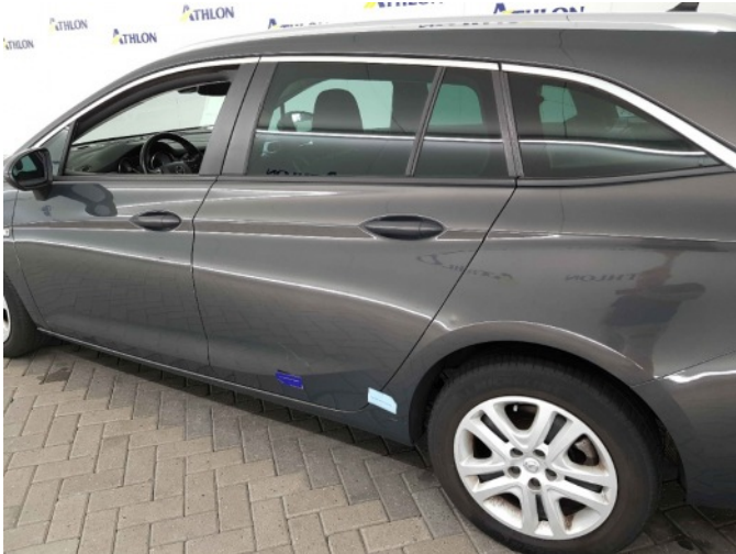
2. Portier achter - links