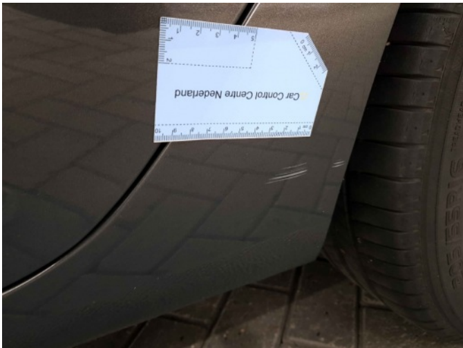
2. Portier achter - links