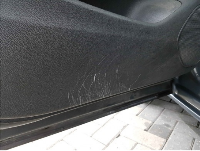
4. Deurbekleding links voor