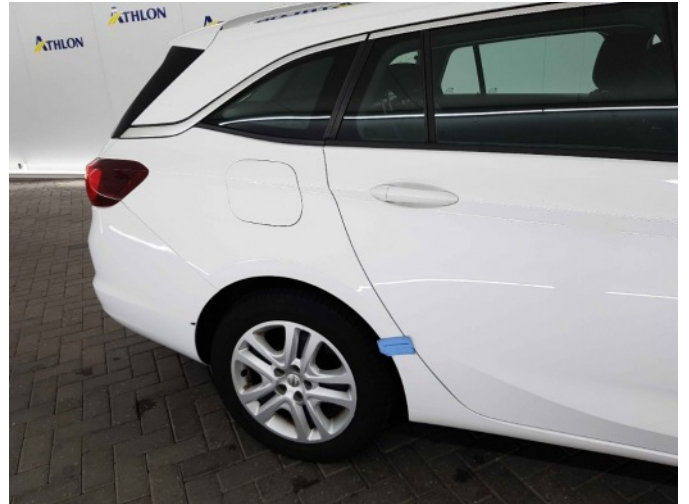
1. Zijwand - achter - rechts