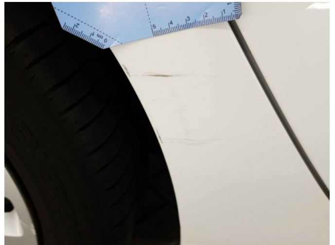
1. Zijwand - achter - rechts