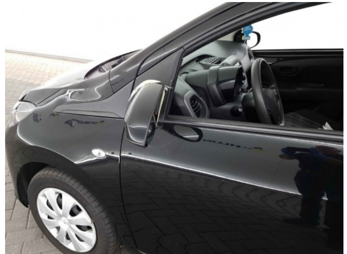
1. Spiegelbehuizing - links