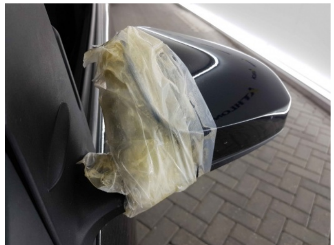
1. Spiegelbehuizing - links