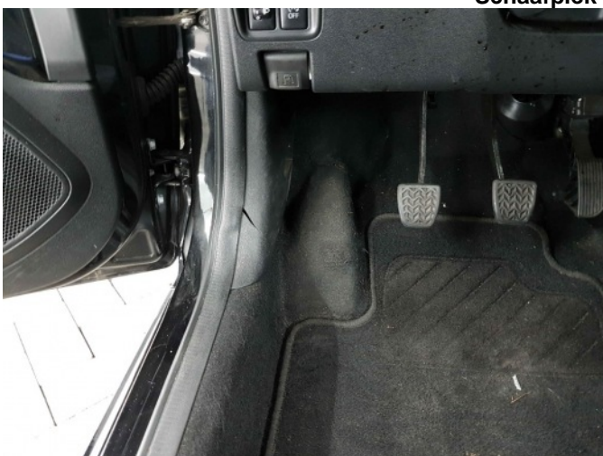
5. bekleding voetstuk l.v.