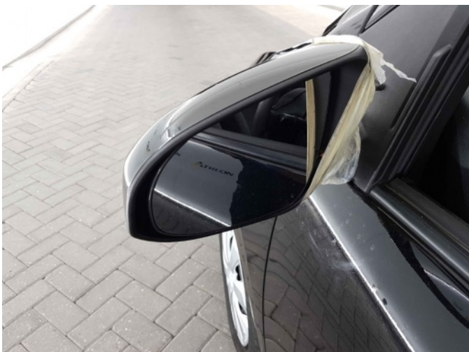
1. Spiegelbehuizing - links