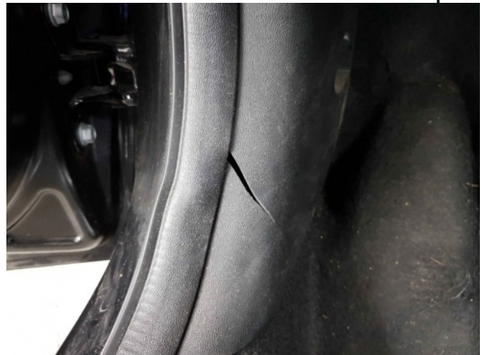
5. bekleding voetstuk l.v.