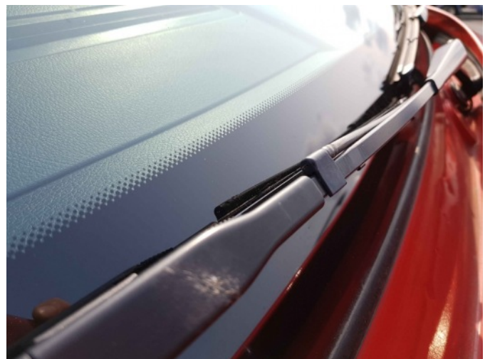
1. Ruitenwissersproeier vernevelaar lv