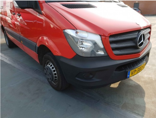
2. Bumper voorzijde rechts