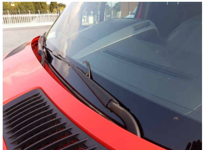
1. Ruitenwissersproeier vernevelaar lv