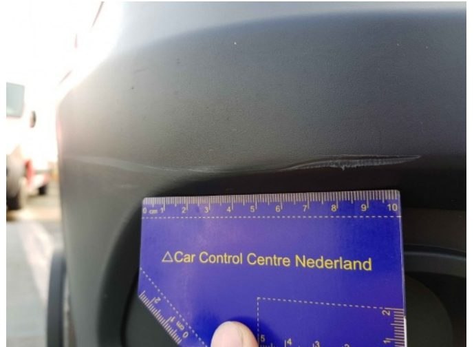
2. Bumper voorzijde rechts