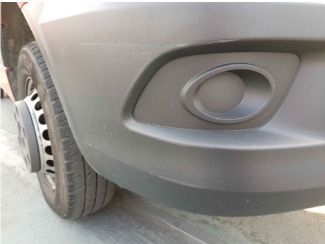
2. Bumper voorzijde rechts