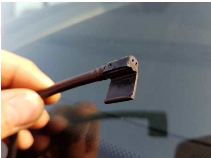
1. Ruitenwissersproeier vernevelaar lv