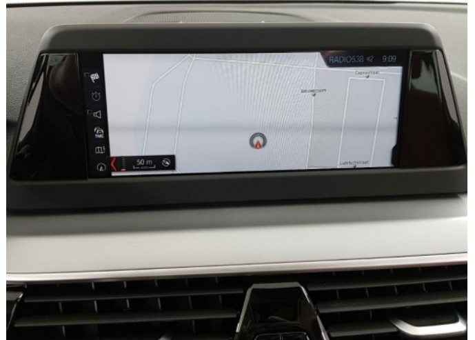
Navigatie of radio