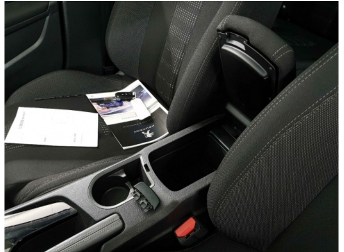
3. vergrendeling middenarmsteun