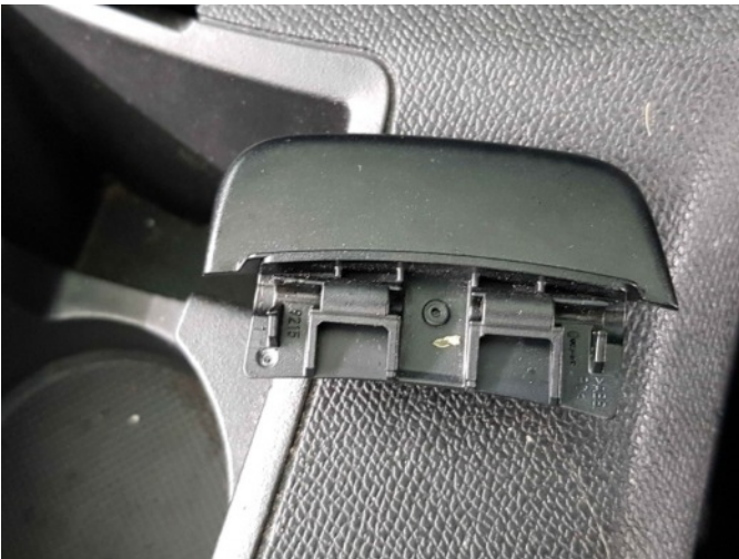
3. vergrendeling middenarmsteun