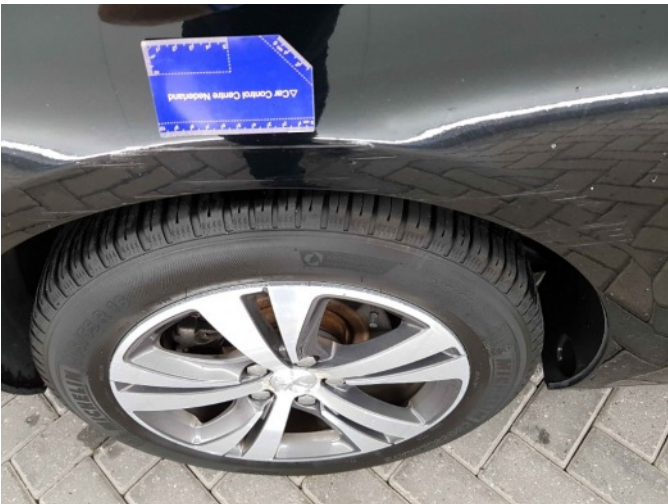
1. Zijwand - achter - rechts