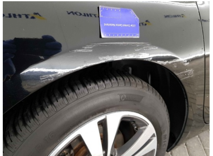
1. Zijwand - achter - rechts