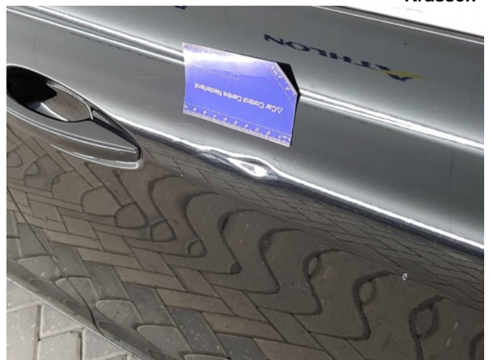
2. Portier voor - rechts