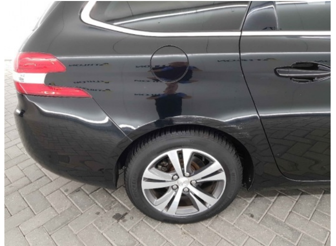
1. Zijwand - achter - rechts