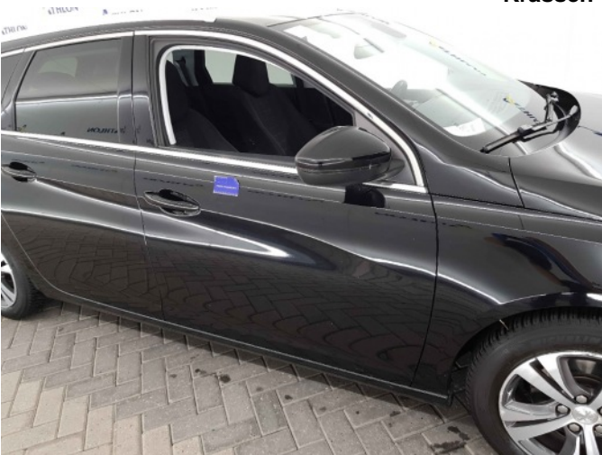
2. Portier voor - rechts