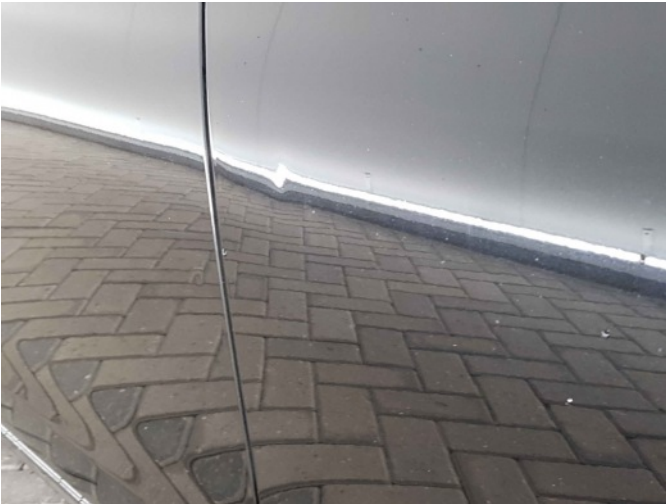
2. Portier voor - rechts