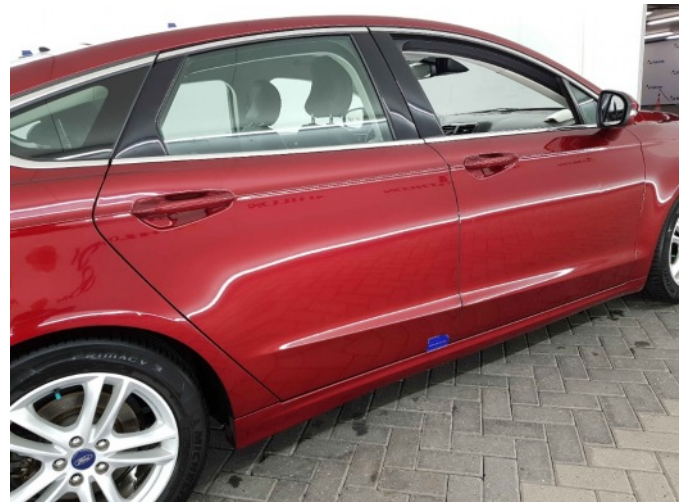
1. Dorpel - rechts