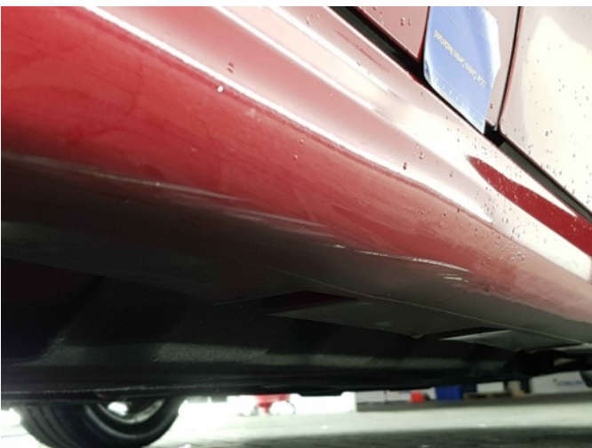
1. Dorpel - rechts