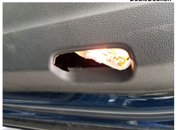
3. glas ra deur