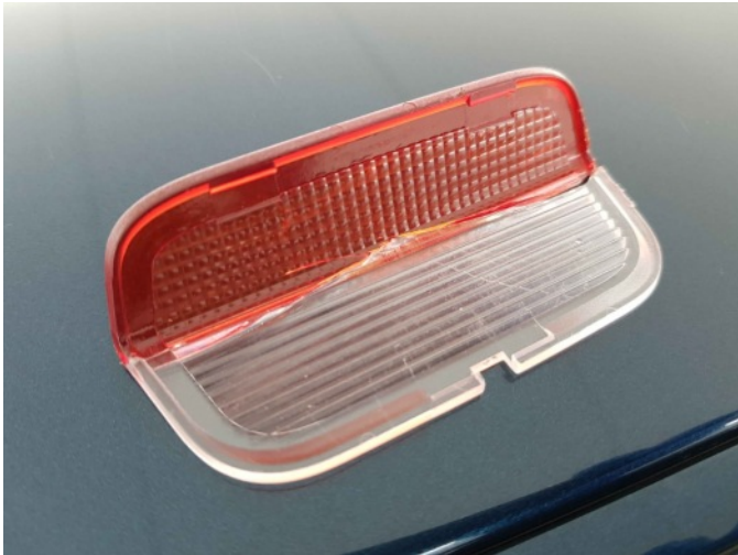
3. glas ra deur