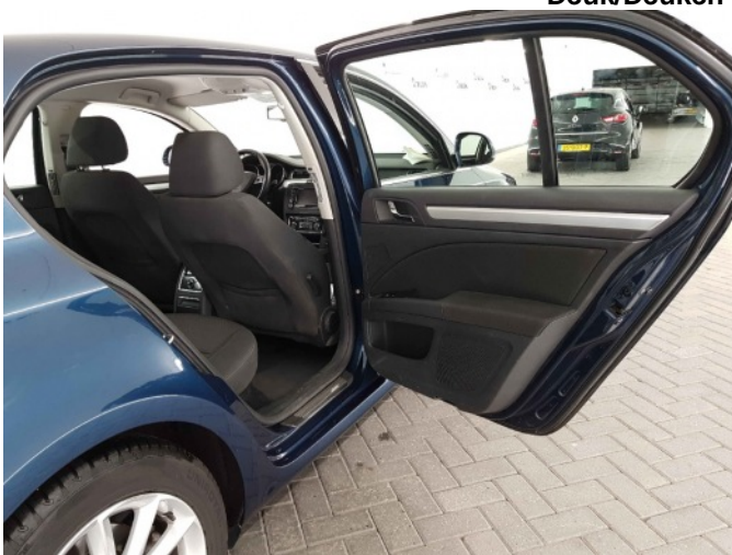
3. glas ra deur