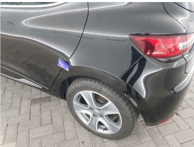
1. Zijwand - achter - Links