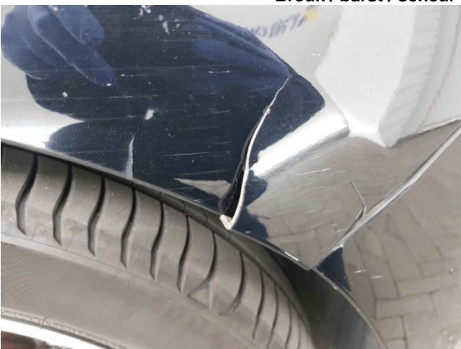
2. Spatbord voor- rechts