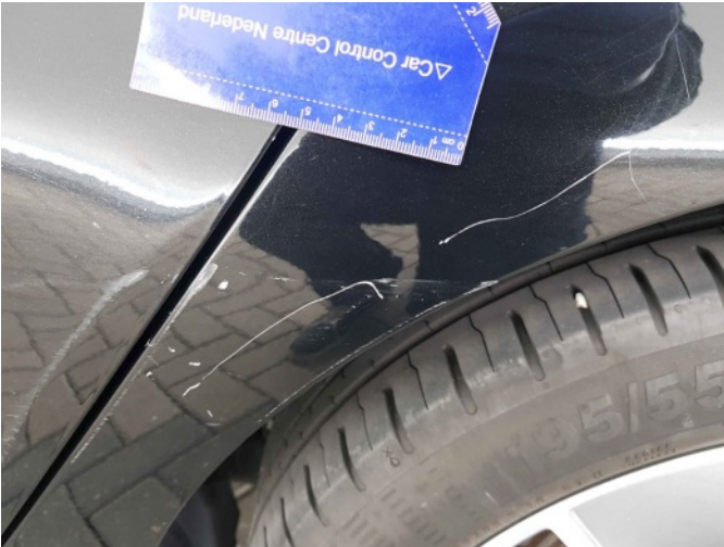
1. Zijwand - achter - Links