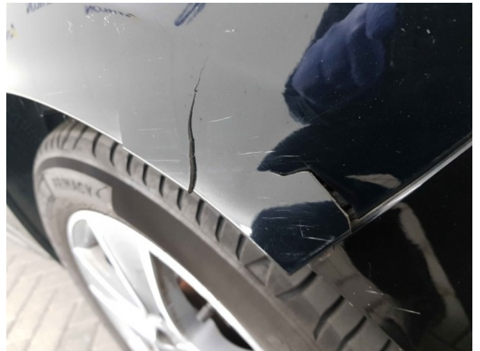
2. Spatbord voor- rechts