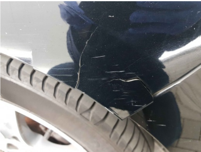
2. Spatbord voor- rechts