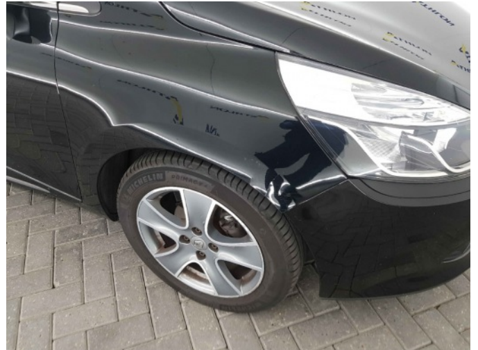
2. Spatbord voor- rechts