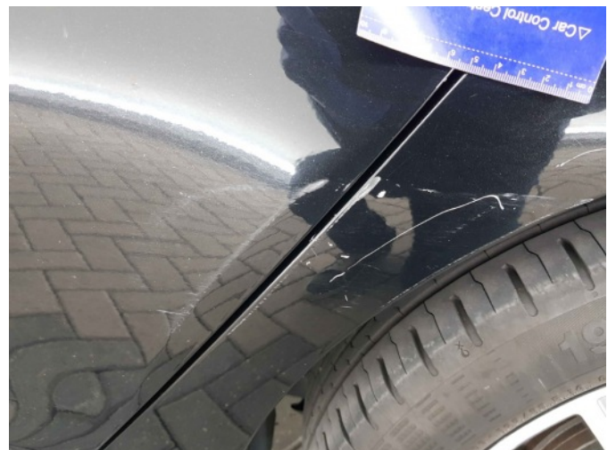
1. Zijwand - achter - Links