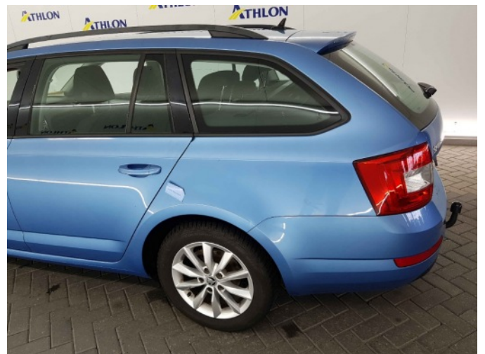
1. Zijwand - achter - Links