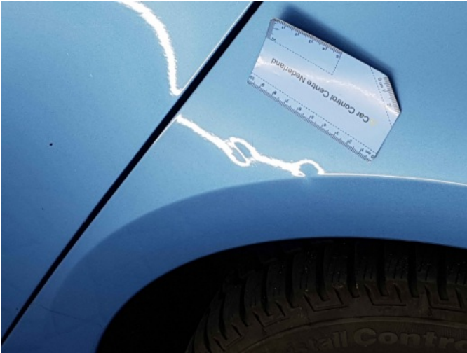
1. Zijwand - achter - Links