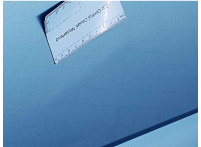
3. Portier voor - rechts