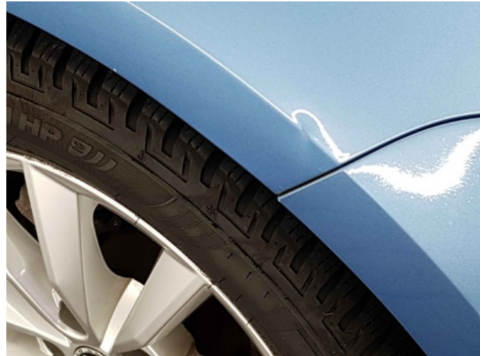
1. Zijwand - achter - Links