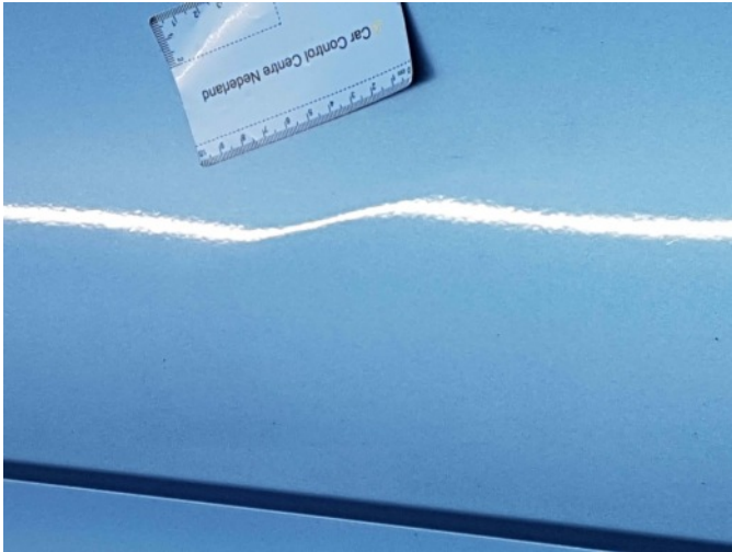
3. Portier voor - rechts