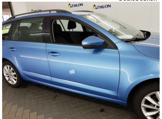
3. Portier voor - rechts