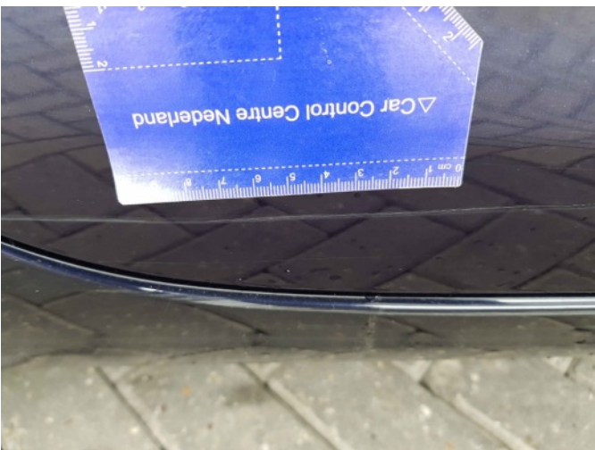
1. Portier achter - rechts