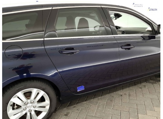
1. Portier achter - rechts