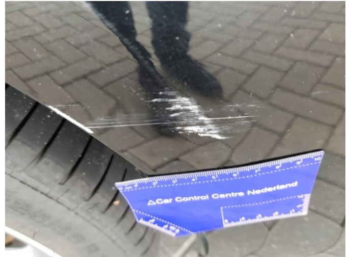
2. Zijwand - achter - rechts