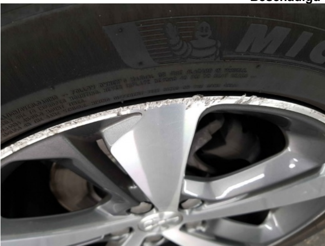
3. Velg voor - rechts