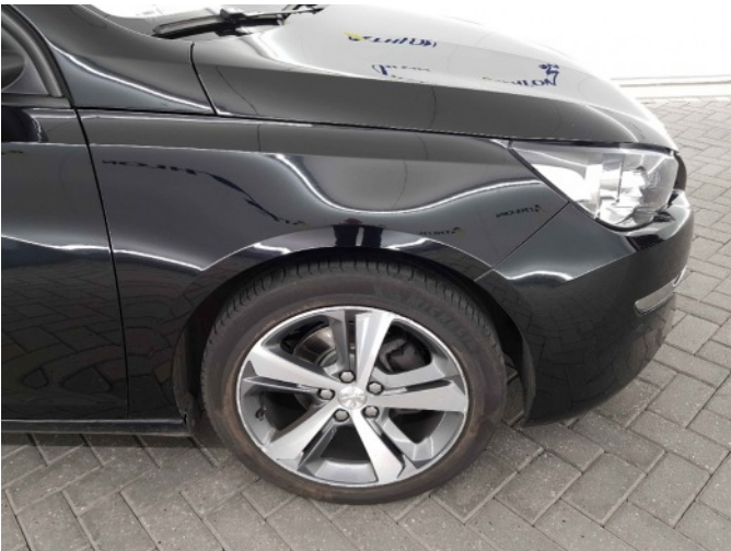
3. Velg voor - rechts