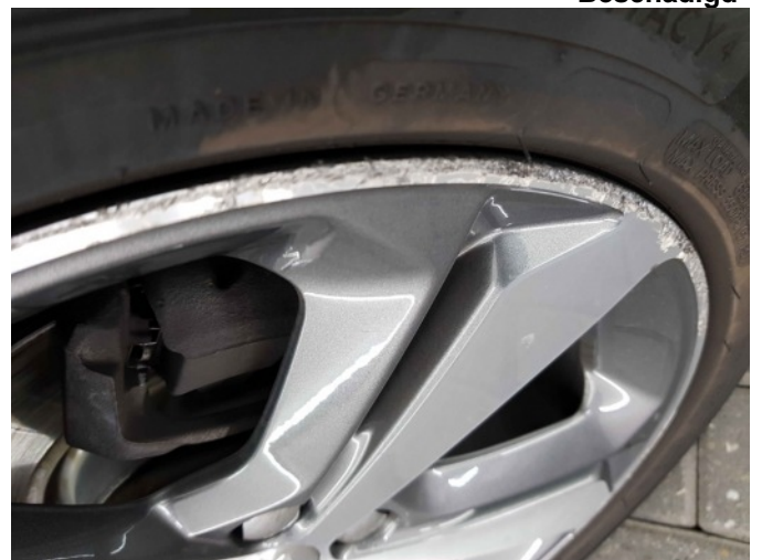
3. Velg voor - rechts