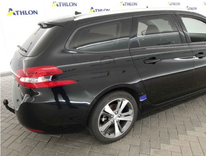
2. Zijwand - achter - rechts