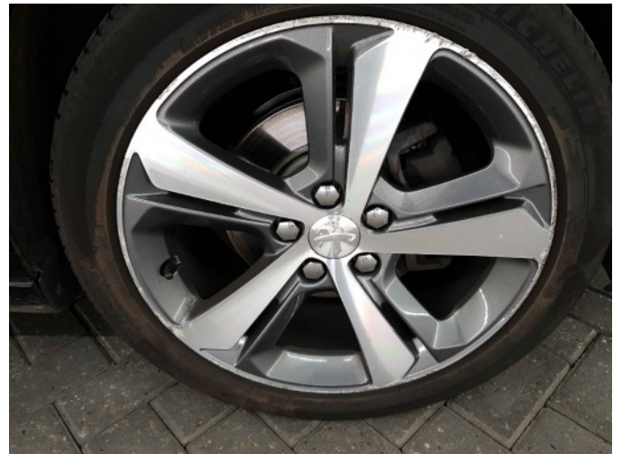
3. Velg voor - rechts